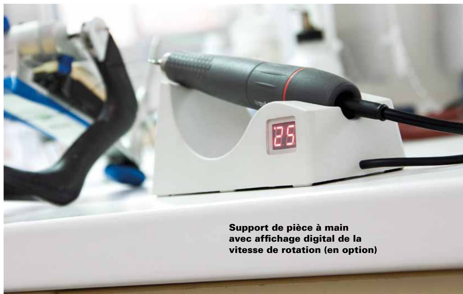
Support de pièce à main avec affichage digital de la vitesse de rotation (en option)