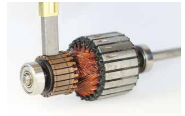
Motor nach 1.000 Stunden durch Ansteuerung mit zukunftsweisender Zubler-Elektronik.