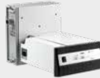
Z1-AT Absauganlage mit Filterkassette